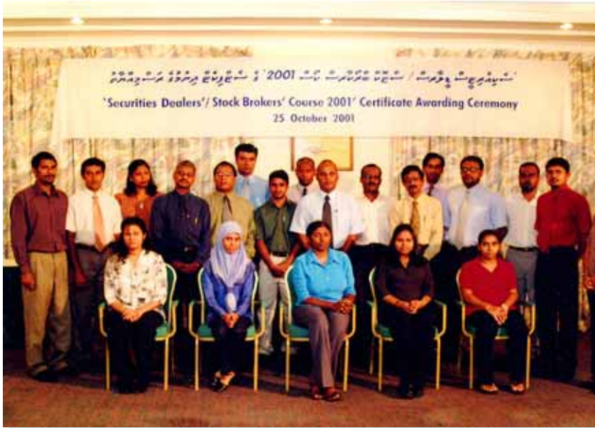
تقدیم گواهینامه دوره 2001 فارغ التحصیلان دوره «دوره های تخصصی / دوره های آموزشی» (2001) (تقدیم گواهینامه)