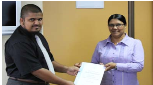
قائمہ شدہ اداروں کے ساتھ باہمی تعلیمی پروگراموں کی سرکاری نشست