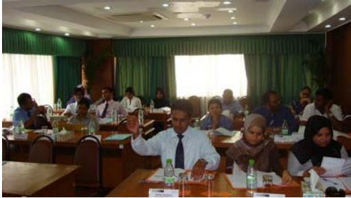
قائمہ شدہ اداروں کے ساتھ باہمی تعلیمی پروگراموں کی سرکاری نشست