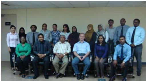
ایگزیکٹو ڈائریکٹرز اور سربراہان اداروں کے ساتھ باہمی تعلیمی پروگراموں کی سرکاری نشست