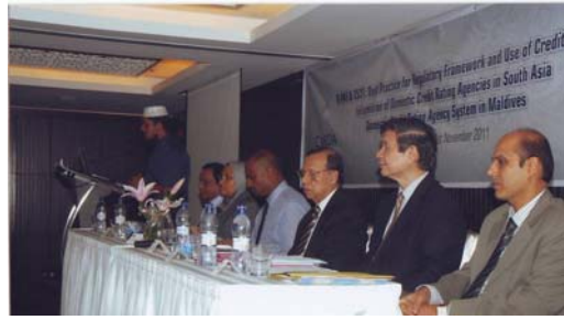
بین الاقوامی تنظیم برائے بین الاقوامی نوآبادیاتی اداروں کے ساتھ باہمی تعلیمی پروگراموں کی سرکاری نشست