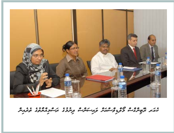
تعليمي ڪورس جي شرڪت ڪندڙن کي ڏسڻ لاءِ (مستشرقين) پرسان پيش ڪيل تعليمي ڪورس جي شرڪت ڪندڙن کي ڏسڻ لاءِ (مستشرقين)