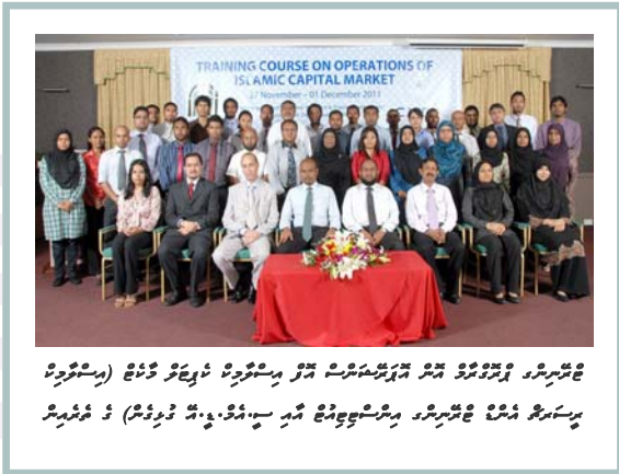
تعليمي ڪورس جي شرڪت ڪندڙن کي ڏسڻ لاءِ (مستشرقين) پرسان پيش ڪيل تعليمي ڪورس جي شرڪت ڪندڙن کي ڏسڻ لاءِ (مستشرقين)