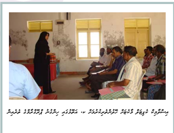
تعليمي ڪورس جي شرڪت ڪندڙن کي ڏسڻ لاءِ (مستشرقين) پرسان پيش ڪيل تعليمي ڪورس جي شرڪت ڪندڙن کي ڏسڻ لاءِ (مستشرقين)