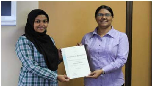
قائمہ شدہ اداروں کے ساتھ باہمی تعلیمی پروگراموں کی سرکاری نشست