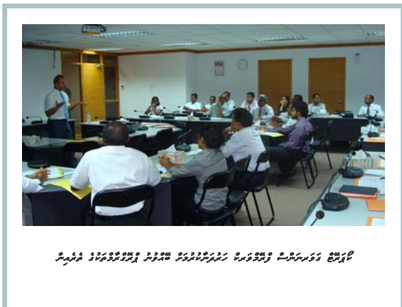
تعليمي ڪورس جي شرڪت ڪندڙن کي ڏسڻ لاءِ (مستشرقين) پرسان پيش ڪيل تعليمي ڪورس جي شرڪت ڪندڙن کي ڏسڻ لاءِ (مستشرقين)