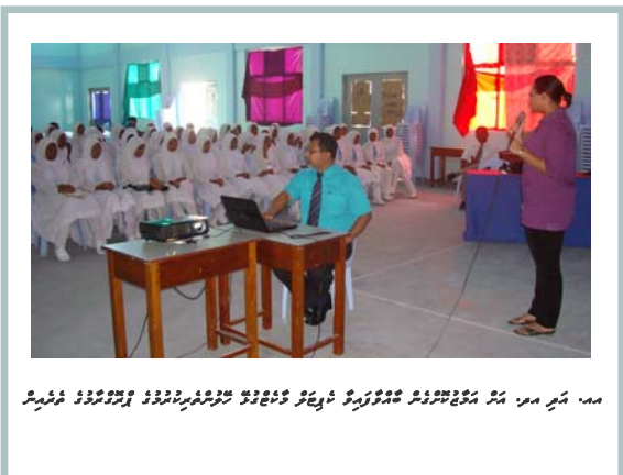
تعليمي ڪورس جي شرڪت ڪندڙن کي ڏسڻ لاءِ (مستشرقين) پرسان پيش ڪيل تعليمي ڪورس جي شرڪت ڪندڙن کي ڏسڻ لاءِ (مستشرقين)