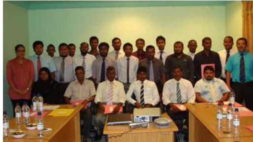
ممبران، ممبران، ممبران کے ساتھ باہمی تعلیمی پروگراموں کی سرکاری نشست