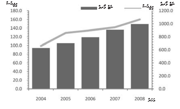
منذ 2004 حتى 2008