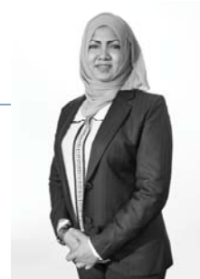
السيد - الرئيس التنفيذي في المملكة العربية السعودية الرئيس التنفيذي في المملكة العربية السعودية د. فهد بن عبد الرحمن الفوزان

بيانات الشركة العامة لعام 2023 في المملكة العربية السعودية