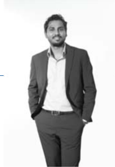
السيد / الرئيس التنفيذي في المملكة العربية السعودية المؤسس المشارك والرئيس التنفيذي د. فهد بن عبد الرحمن الفوزان