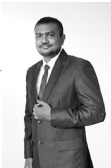
السيد - الرئيس التنفيذي في المملكة العربية السعودية المؤسس المشارك والرئيس التنفيذي د. فهد بن عبد الرحمن الفوزان