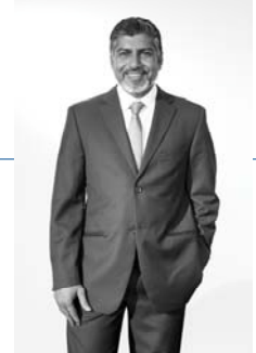
السيد / الرئيس التنفيذي في المملكة العربية السعودية المؤسس المشارك والرئيس التنفيذي 7483 مركز الملك عبدالعزيز الثقافي العالمي