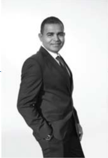
السيد - الرئيس التنفيذي في المملكة العربية السعودية المؤسس المشارك والرئيس التنفيذي د. فهد بن عبد الرحمن الفوزان

بيانات الشركة العامة لعام 2023 في المملكة العربية السعودية