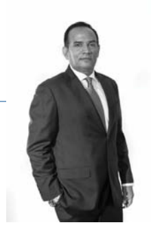
السيد / الرئيس التنفيذي في المملكة العربية السعودية الرئيس التنفيذي في المملكة العربية السعودية د. فهد بن عبد الرحمن الفوزان