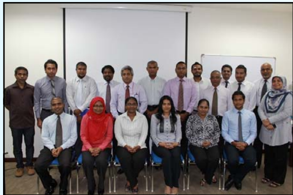
اعضای هیئت مدیره در جلسه هیئت مدیره

هیئت مدیره در سال ۱۳۹۸ و ۱۳۹۹، با تمرکز بر بهبود عملکرد و افزایش بهره‌وری، اقدامات متعددی را انجام داد. در این راستا، هیئت مدیره با تصویب برنامه عملیاتی برای سال ۱۳۹۸ و ۱۳۹۹، همچنین با تصویب گزارش عملکرد هیئت مدیره در سال ۱۳۹۸ و ۱۳۹۹، به تصویب اعضا رسید.