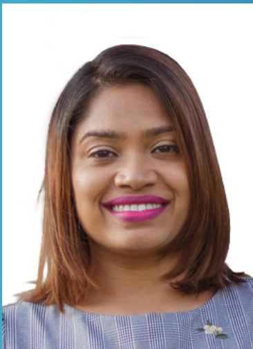
අනුරාධ ප්‍රසාද (අධ්‍යක්ෂ ජනරාල්)