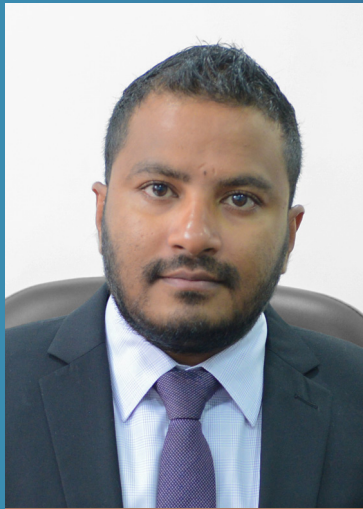
අනුරාධ ප්‍රසාද (අධ්‍යක්ෂ ජනරාල්)