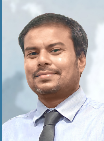
අධ්‍යක්ෂ ජනරාල්වරුන්ගේ කාර්ය මණ්ඩලයේ සාමාජිකයන් 23 දෙනෙකු