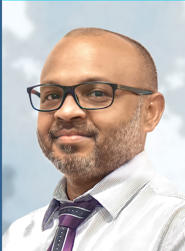
අධ්‍යක්ෂ ජනරාල්වරුන්ගේ කාර්ය මණ්ඩලයේ සාමාජිකයන් 23 දෙනෙකු