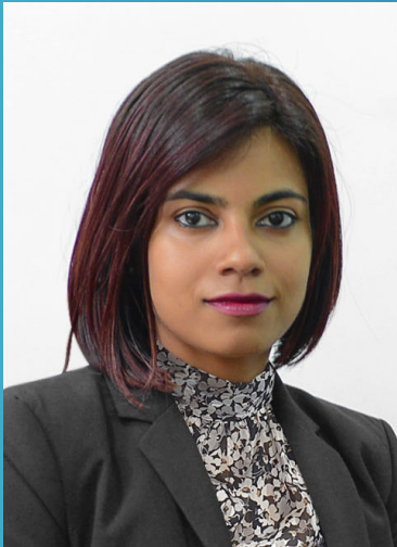
අනුරාධ ප්‍රසාද (අධ්‍යක්ෂ ජනරාල්)