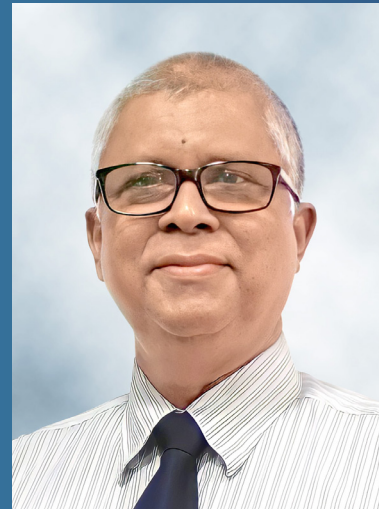
අනුරාධ ප්‍රසාද (අධ්‍යක්ෂ ජනරාල්)