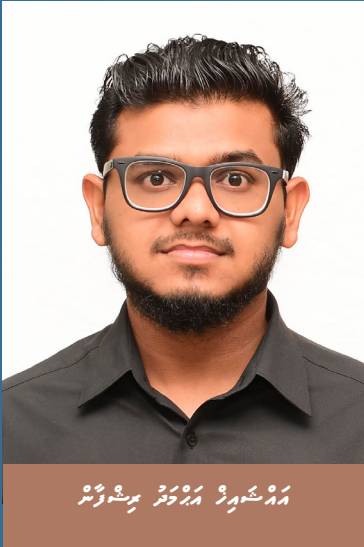
සමුදායේ සාමාජිකයන්ගේ ඡායාරූප