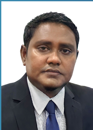
අනුරාධ ප්‍රසාද (අධ්‍යක්ෂ ජනරාල්)