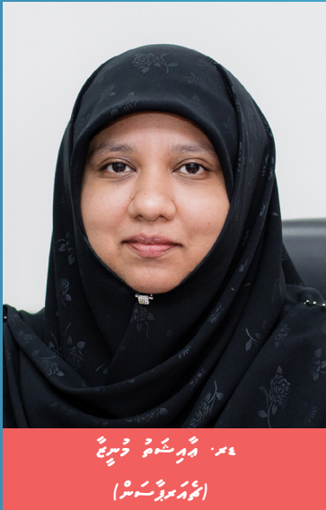
සමුදායේ සාමාජිකයන්ගේ ඡායාරූප (සමුදායේ සාමාජිකයන්ගේ ඡායාරූප)