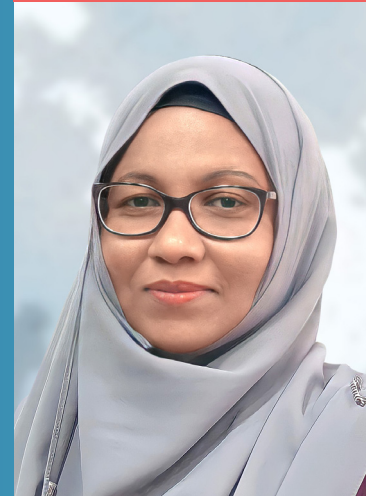
අධ්‍යක්ෂ ජනරාල්වරුන්ගේ කාර්ය මණ්ඩලයේ සාමාජිකයන් 23 දෙනෙකු