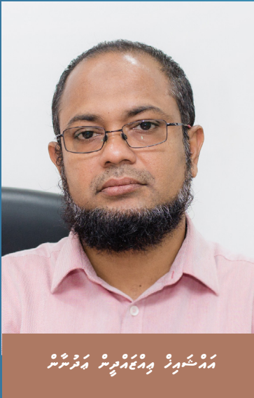
සමුදායේ සාමාජිකයන්ගේ ඡායාරූප