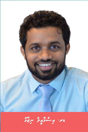
සමුදායේ සාමාජිකයන්ගේ ඡායාරූප