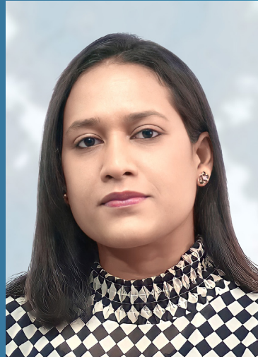
අධ්‍යක්ෂ ජනරාල්වරුන්ගේ කාර්ය මණ්ඩලයේ සාමාජිකයන් 23 දෙනෙකු