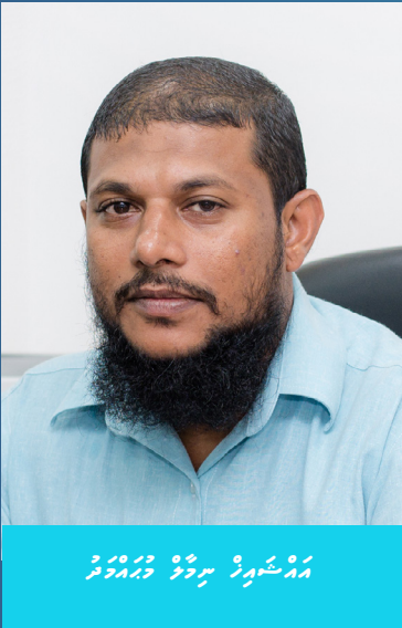
සමුදායේ සාමාජිකයන්ගේ ඡායාරූප

සමුදායේ සාමාජිකයන්ගේ ඡායාරූප (CMSAC) යනු කැරැණික සංවිධානයකට සාමාජිකයන්ගේ සහභාගිත්වය සහතික කරයි. සමුදායේ සාමාජිකයන්ගේ ඡායාරූප සමුදායේ සාමාජිකයන්ගේ සහභාගිත්වය සහතික කරයි. සමුදායේ සාමාජිකයන්ගේ ඡායාරූප සමුදායේ සාමාජිකයන්ගේ සහභාගිත්වය සහතික කරයි.