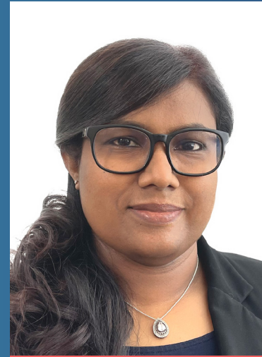
අනුරාධ ප්‍රසාද (අධ්‍යක්ෂ ජනරාල්)