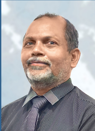
අධ්‍යක්ෂ ජනරාල්වරුන්ගේ කාර්ය මණ්ඩලයේ සාමාජිකයන් 23 දෙනෙකු