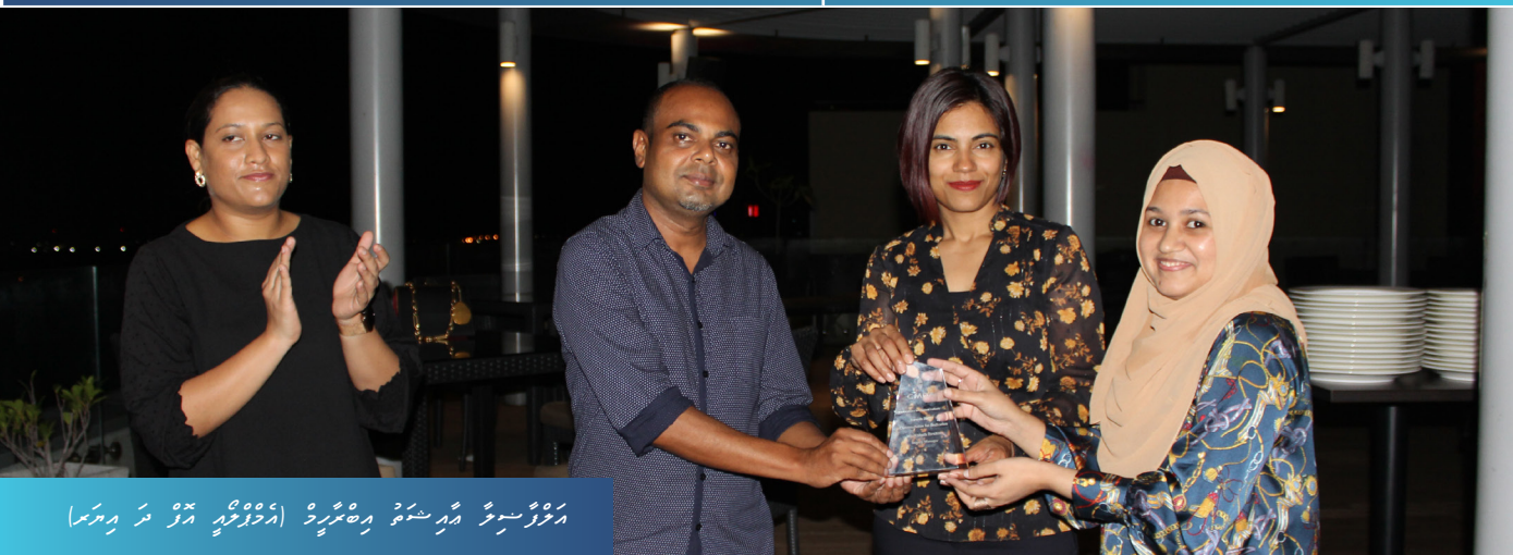
تتميزنا بمبادراتنا الخاصة التي تهدف إلى تحقيق أهدافنا الاستراتيجية.