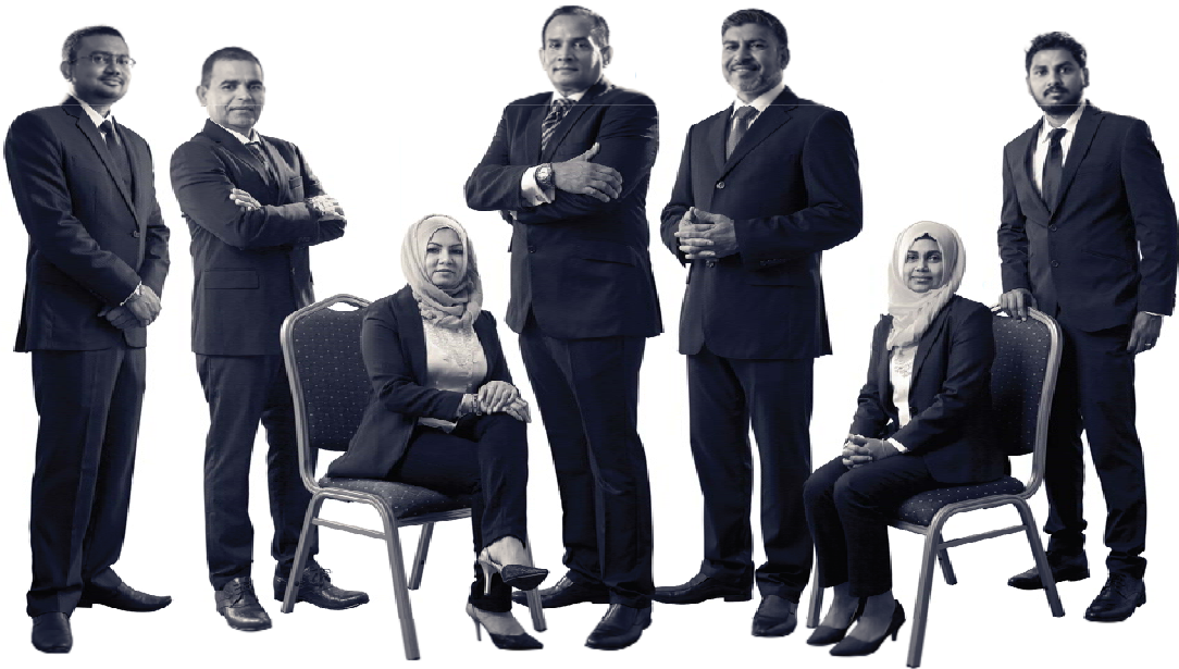
قرارداد لے کر

حکومتی برسرہ جھڑپا لڑی ہو لیسٹریٹی و گرانٹس