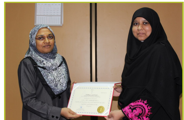
ایگزیکٹو ٹریننگ کورس میں شرکت کنندگان کو سرٹیفکیٹ پیش کرنا