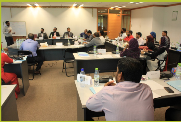
پروفیشنل ڈیولپمنٹ اینڈ کوریجنگ سیکٹور میں ایگزیکٹو ٹریننگ - 2014