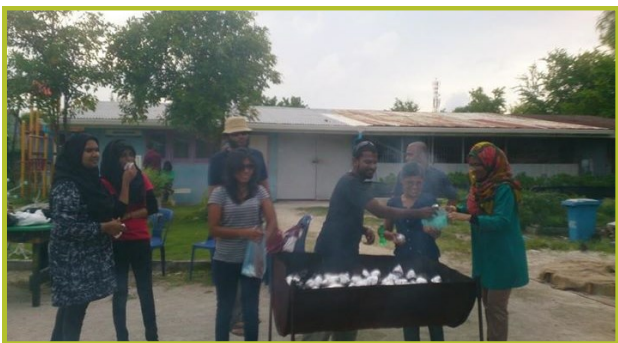
سپ.ا.و.پ. د وروستۍ ورځې د وروستۍ ورځې - 2014

د وروستۍ ورځې د وروستۍ ورځې د وروستۍ ورځې د وروستۍ ورځې د وروستۍ ورځې د وروستۍ ورځې د وروستۍ ورځې د وروستۍ ورځې