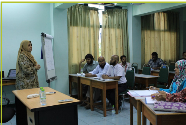
INCEIF و MIFP ٹریننگ کورس