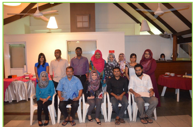
2014 کال د وروستۍ ورځې د وروستۍ ورځې

د وروستۍ ورځې د وروستۍ ورځې د وروستۍ ورځې د وروستۍ ورځې د وروستۍ ورځې د وروستۍ ورځې د وروستۍ ورځې د وروستۍ ورځې د وروستۍ ورځې د وروستۍ ورځې د وروستۍ ورځې د وروستۍ ورځې د وروستۍ ورځې د وروستۍ ورځې د وروستۍ ورځې د وروستۍ ورځې