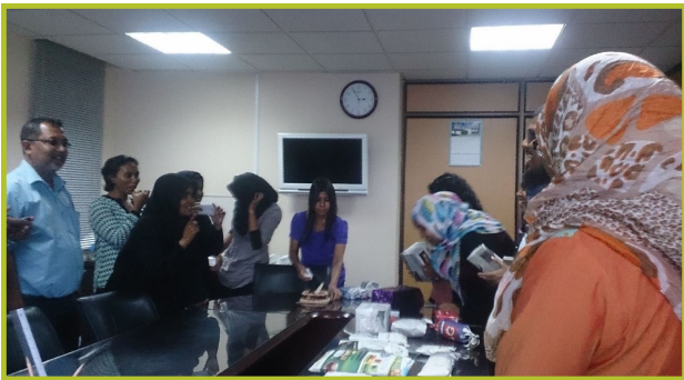
سپ.ا.و.پ. د وروستۍ ورځې د وروستۍ ورځې - 2014

د وروستۍ ورځې د وروستۍ ورځې د وروستۍ ورځې د وروستۍ ورځې د وروستۍ ورځې د وروستۍ ورځې د وروستۍ ورځې د وروستۍ ورځې د وروستۍ ورځې د وروستۍ ورځې د وروستۍ ورځې د وروستۍ ورځې