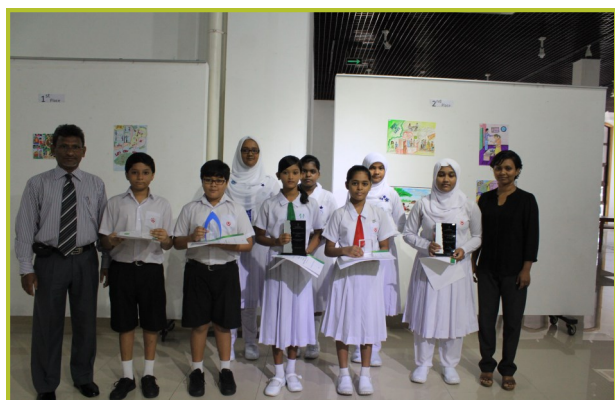
پاکستان ٹیلی ویژن کی سرمایہ کاری - 2014

نایاب و ڈیجیٹل مارکیٹ میں سرمایہ کاری کے مواقع 8 ستمبر 2014ء کو 11 ستمبر 2014ء کو