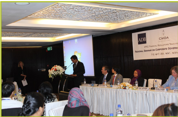
ایگزیکٹو ٹریننگ کورس کورپوریٹ گورننس - 2014