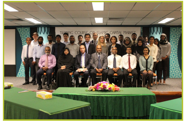
ایگزیکٹو ٹریننگ کورس اسلامک کپٹل مارکیٹ - 2014