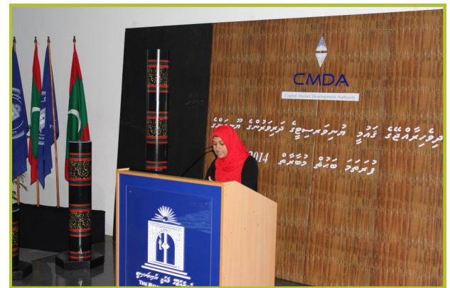
سیکرٹری ڈیپارٹمنٹ - 2014